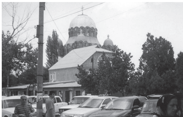
Фото Святознаменского храма в Хасавюрте с незаконной застройкой его фасада