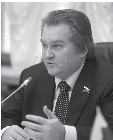
Михаил Емельянов, депутат Государственной Думы России