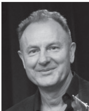
Михаил Кабанов, Народный артист России, режиссёр